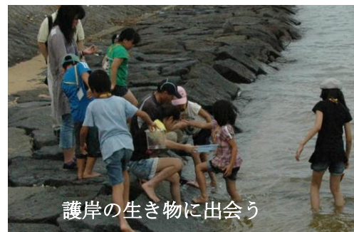
護岸の生き物に出会う