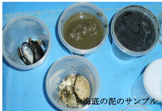
海底の泥のサンプル