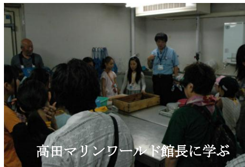
高田マリンワールド館長に学ぶ

台風のために海が荒れる前に採取されて海底の泥を見せてもらいました。黒くてぬるぬるしていて臭かった。腐ったような匂いがしたのはなぜなのでしょう？サンプルには貝ガラも数種類ありました。健全な生態系なのでしょうか？