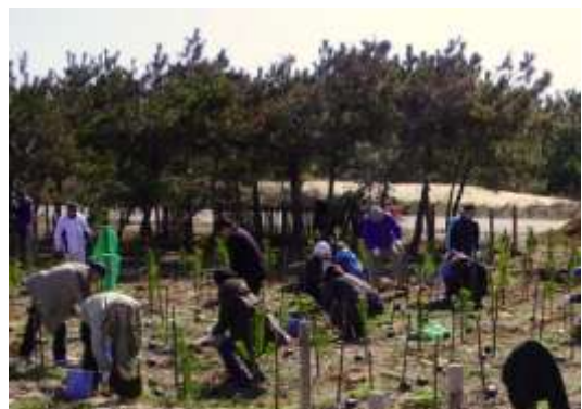
植樹活動（国立海の中道海浜公園 東区）