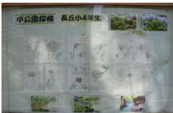
思いが伝わる掲示板（長丘中公園 南区）