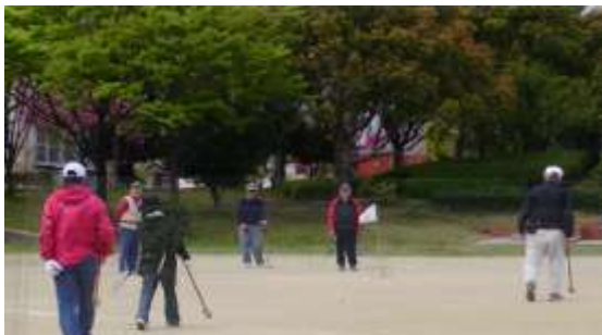
ゲートボール箱崎公園（地区公園 東区）