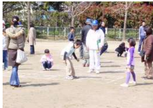
ケンケンパ大会（名島公園 東区）