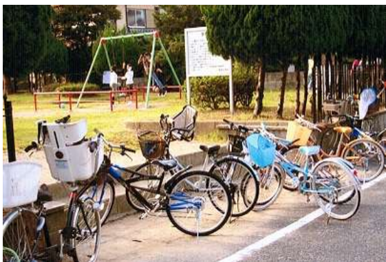
いつもの公園遊び（原北公園 早良区）