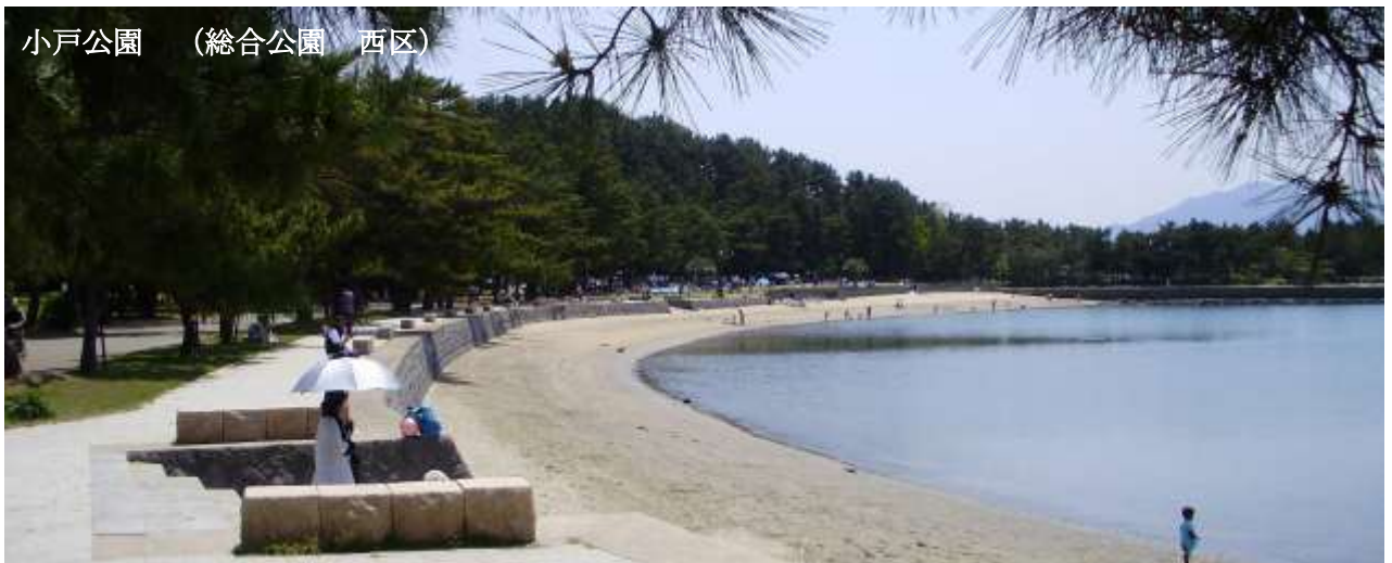
小戸公園 (総合公園 西区)