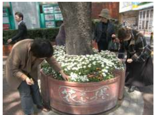
歩道を花いっぱい（赤坂 中央区）