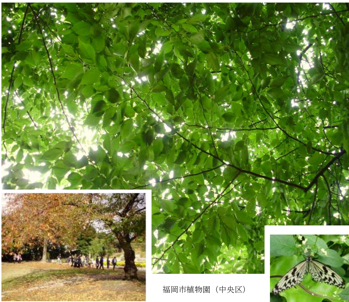
福岡市植物園（中央区）

こうえん りよくち かつよう かんきょうえんしゆつ 公園や緑地を活用して環境演出をしましょう。