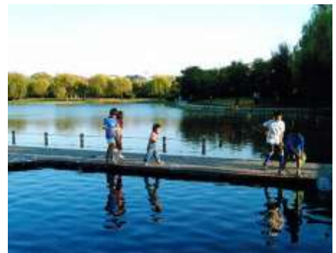
上) 諸岡親水公園 (諸岡溜池 博多区) 左) 東公園 (総合公園 博多区)

人間も普段の生活の中で自然とのつながりを感じ性によって感じる場所が必要。 自然の少ない都会の真ん中だからこそもっと多くの緑の環境がほしい。