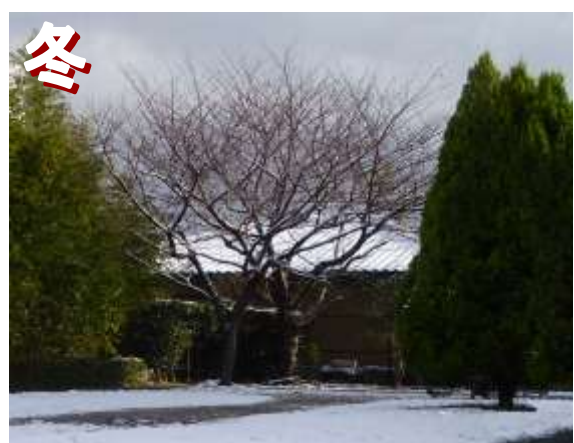
別府2丁目公園（幼児公園 城南区）