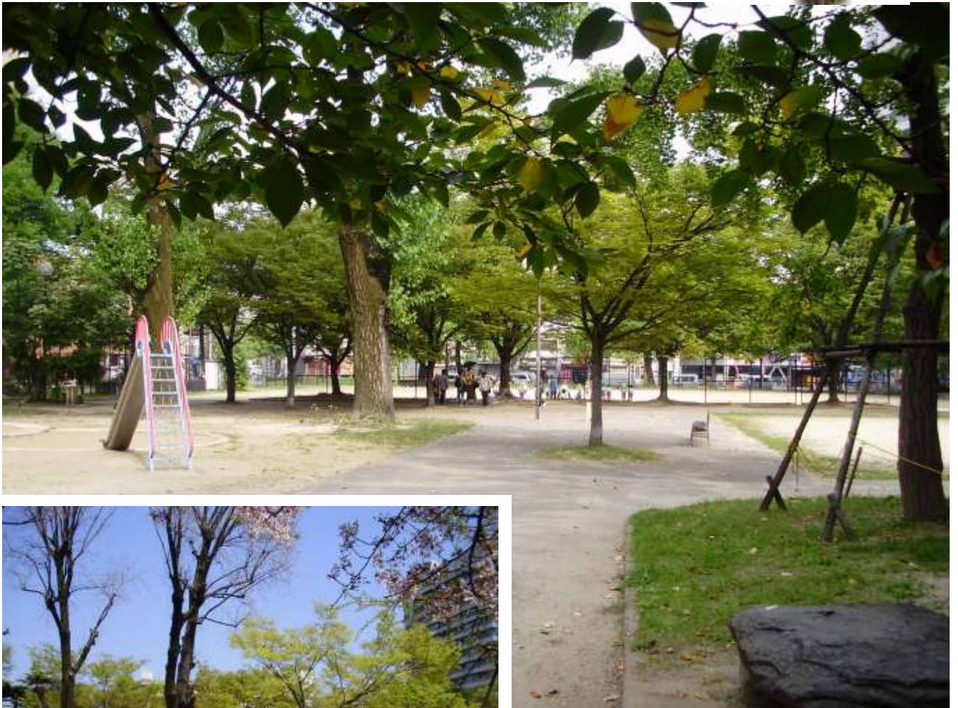
浜の町公園(街区公園 中央区)