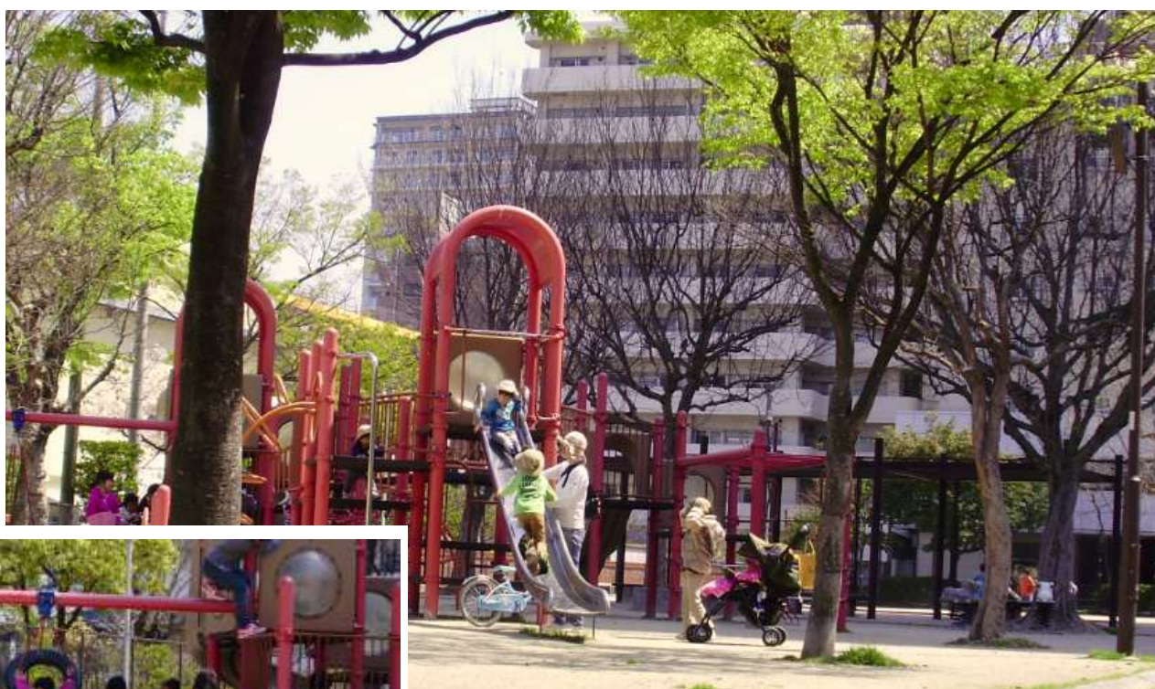
簗子公園(街区公園 中央区)