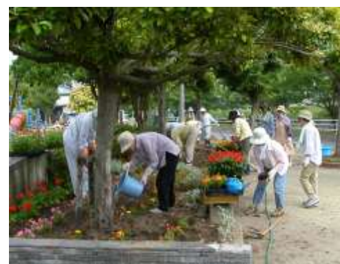
吉塚東公園 (街区公園 博多区)